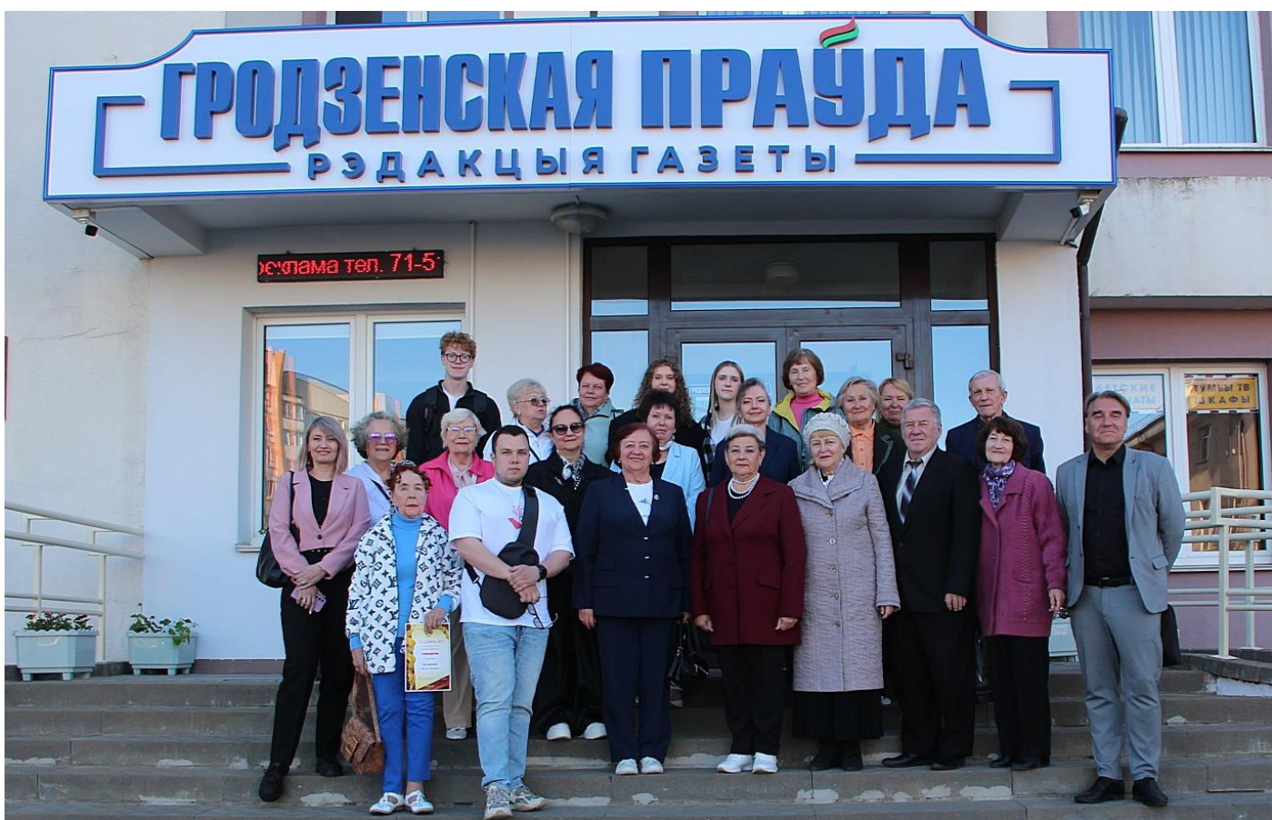
СЛОВОДРОМ # 75