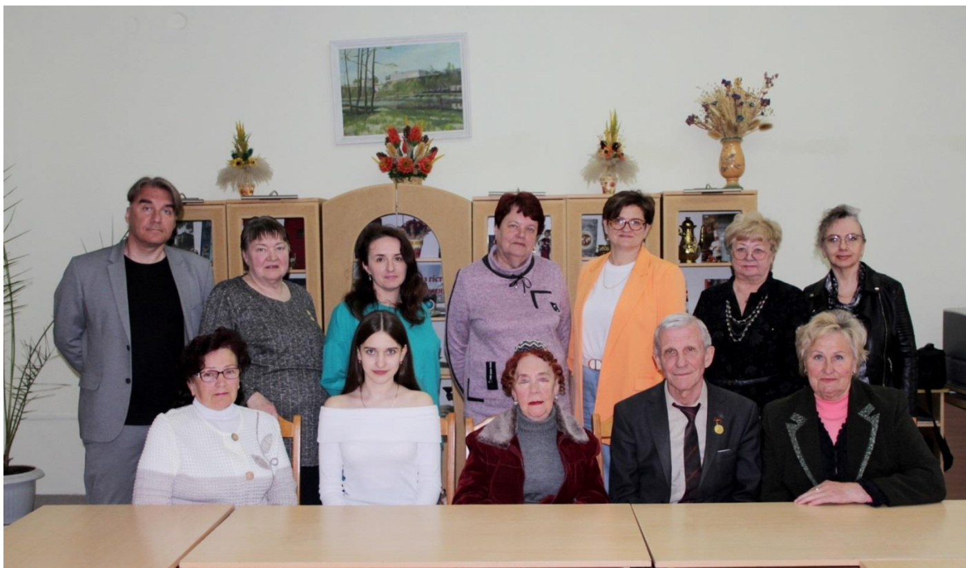
СЛОВОДРОМ # 66