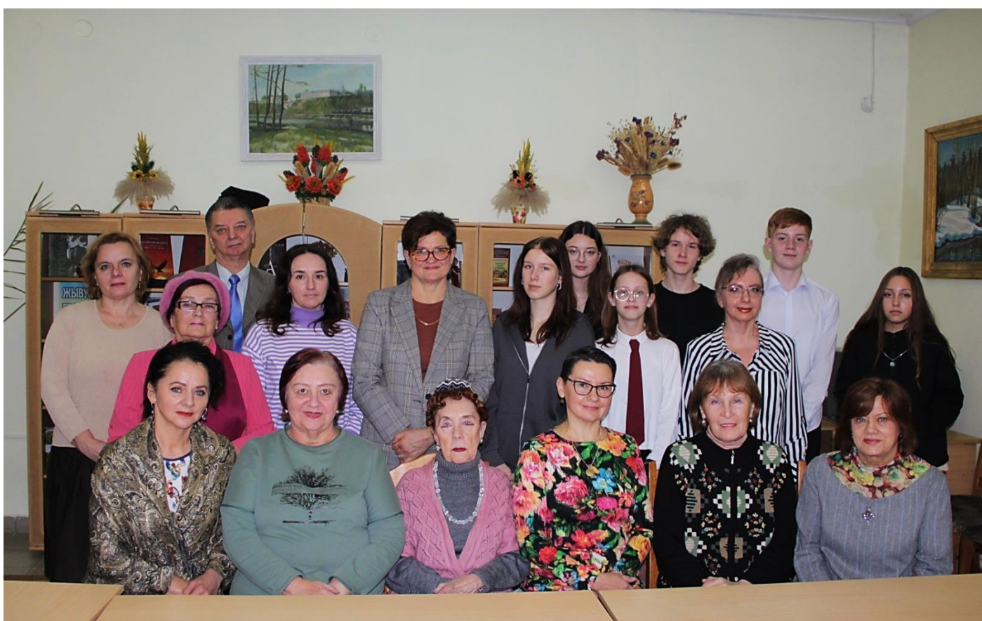
Словодром #61