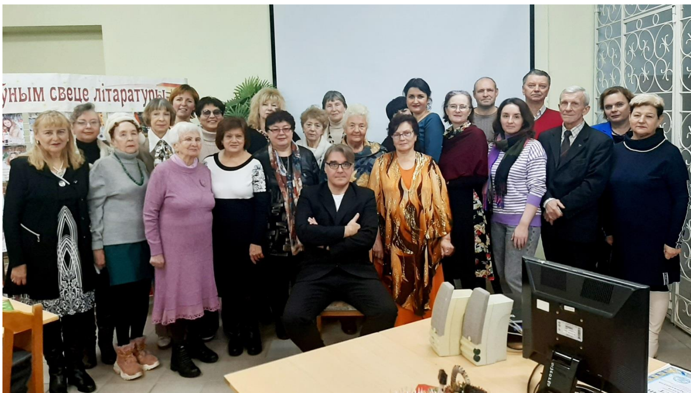
СЛОВОДРОМ # 53