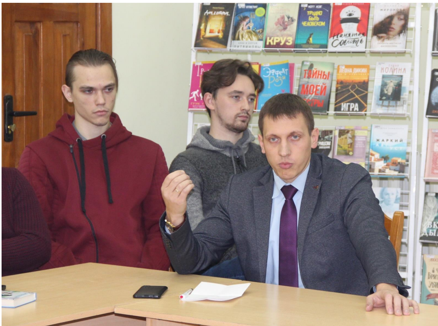
Выступает А. В. Макаревич