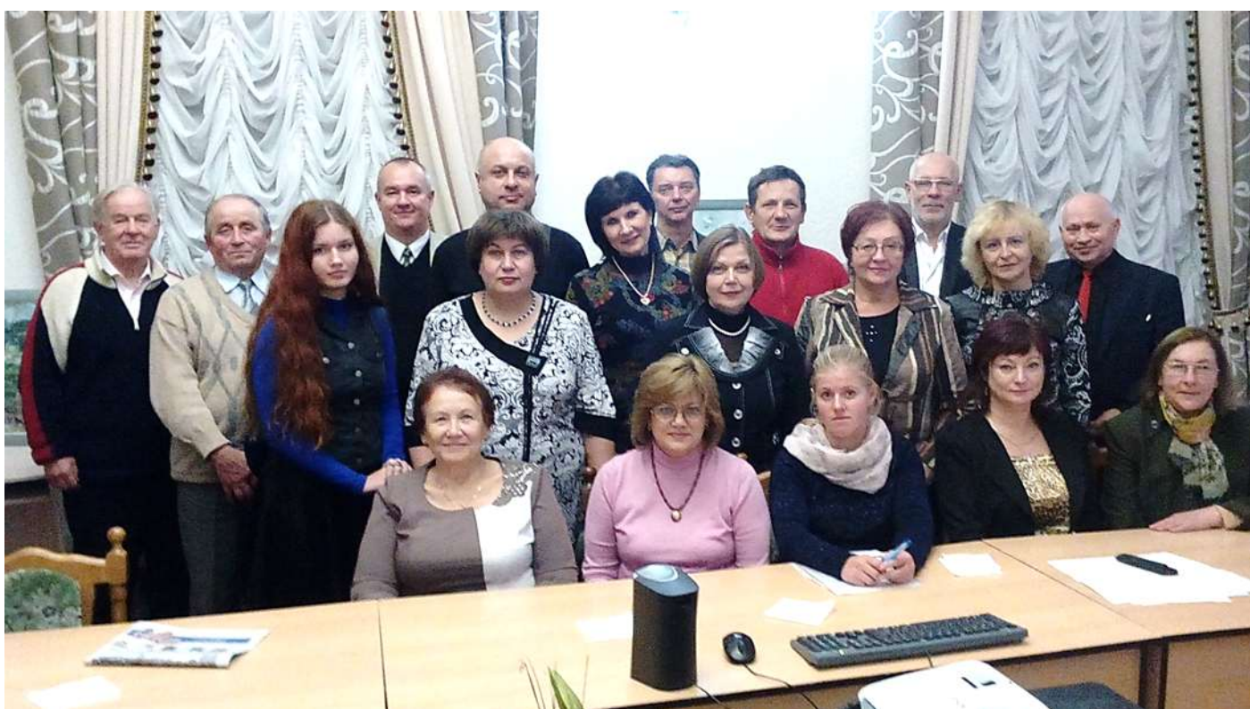
И ещё одна встреча в общественном дискуссионном клубе «Словодром» стала историей. Гродно, Областная научная библиотека им. Е.Карского. 25 октября 2016 года.