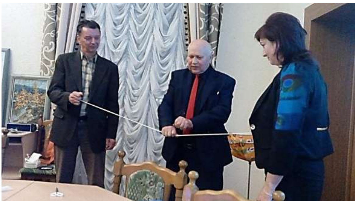
Обманутая публика довольна.