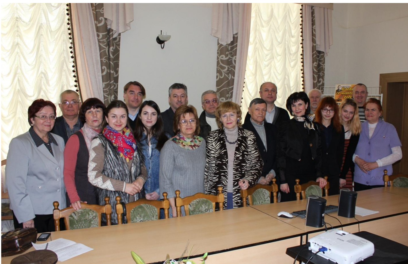
«Словодром-6», 26 апреля 2016 г. Все вместе на новом месте.