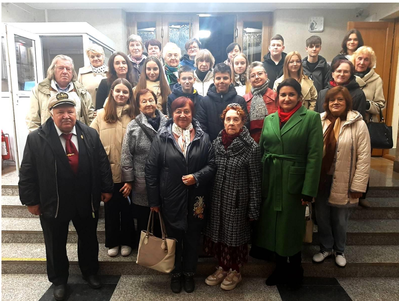
Словодром # 51. После заседания (фото «на ход ноги»)