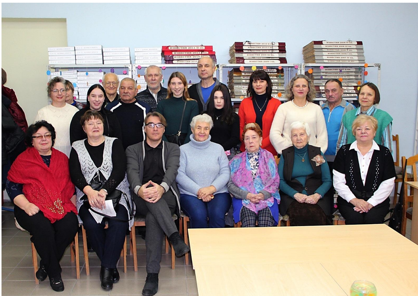
Словодром # 37 на новом месте. Тема дискуссии «Мой прогресс». 27 ноября 2019 года.