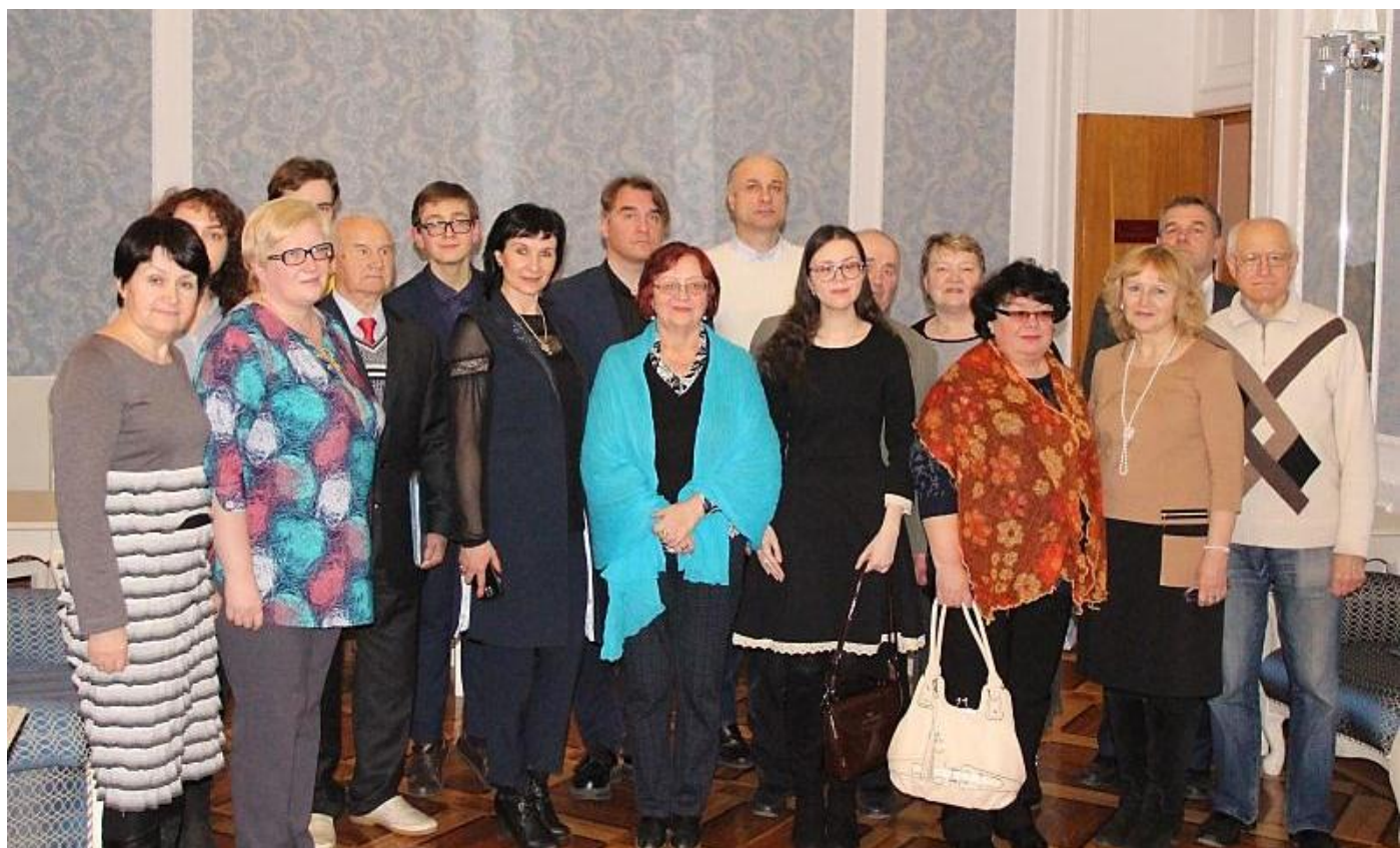
«Словодром» # 32