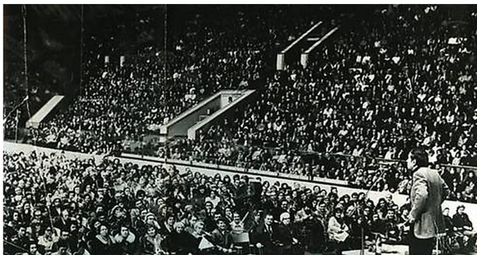
1960-е годы. Поэт Андрей Вознесенский выступает на стадионе

Порассуждать хотелось не только о поэзии, но ещё и о популярности литературы и литературного творчества, об их социализации, о роли творческого начала в человеческой сущности, о месте в нашем мире таких понятий, как слово, образ и конечно, объединяющая их мысль... Ведь литература всегда влияла на умы. Но поколение книголюбителей сменилось