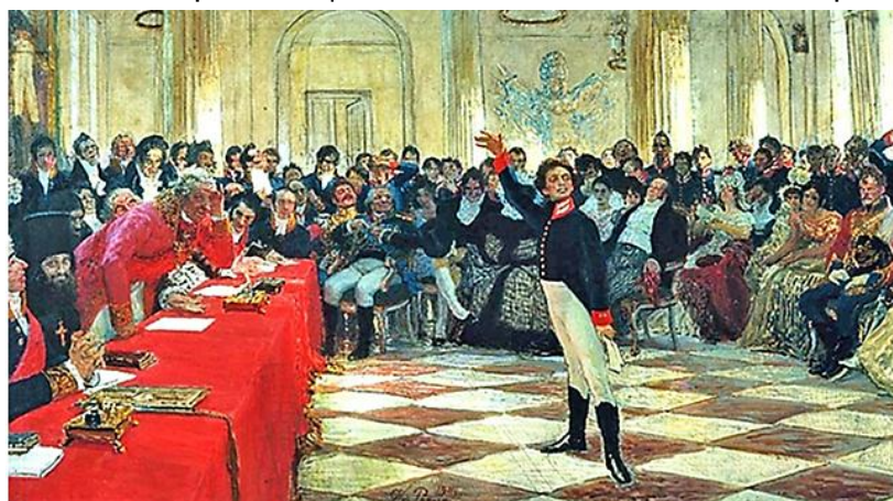
Пушкин в Царском селе. Художник И.Е.Репин

Как-то само собой родилось решение разделить участников литературного вечера на две команды – «Гродненщина поэтическая. Век XX» и «Гродненщина поэтическая. Век XXI», а также