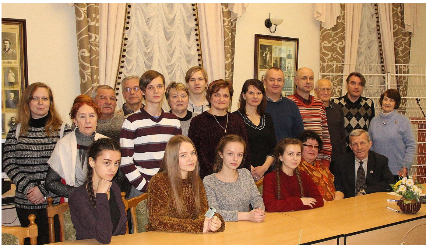
Словодром # 30. 30 января 2019 года. Гродно, Новый замок.