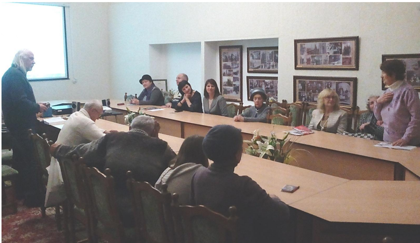
Под занавес встречи.