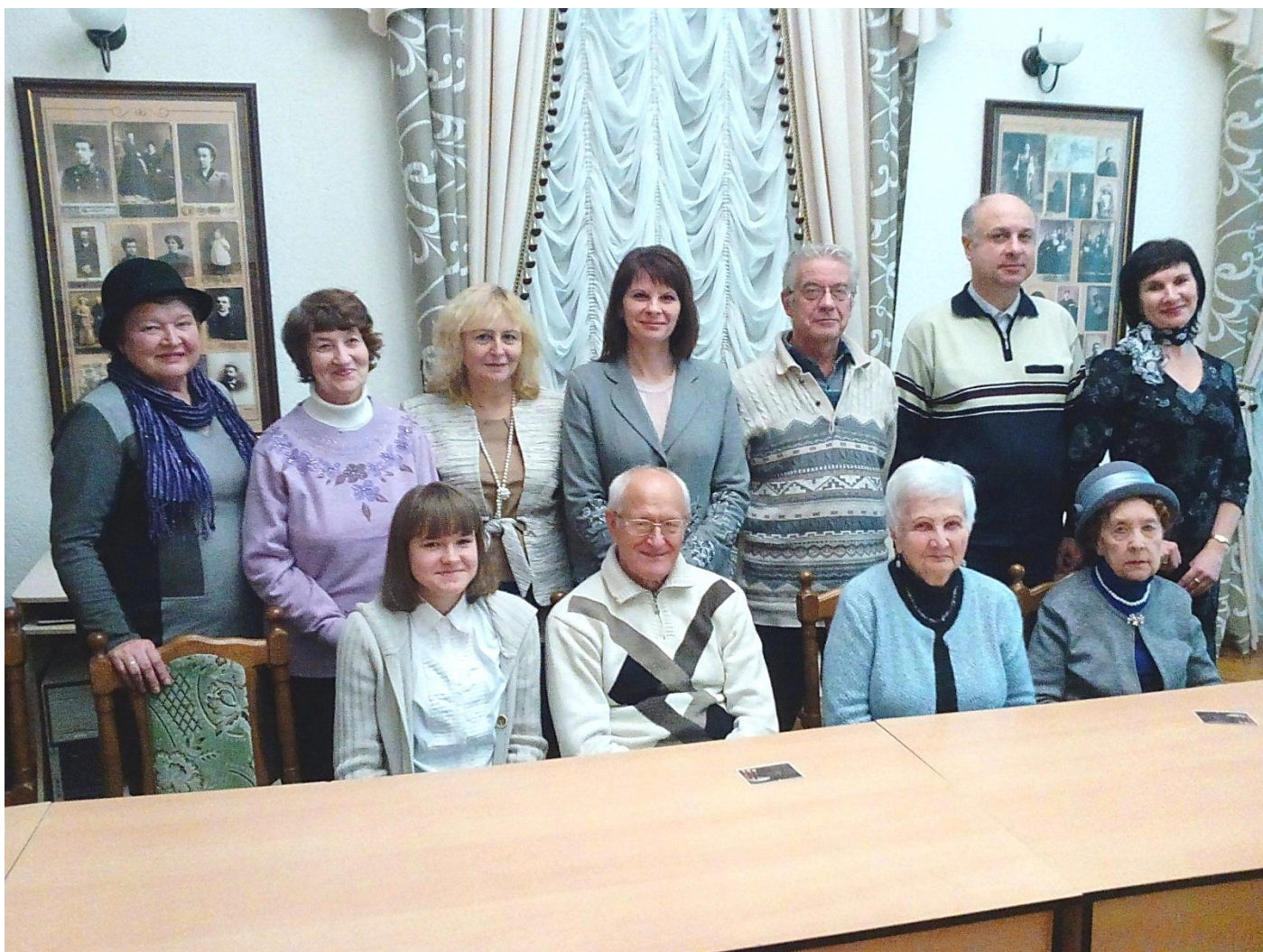
Историей стало и заседание клуба «Словодром» # 28. Новый замок, 28 ноября 2018 года. Фото – мои; за качество прошу прощения...