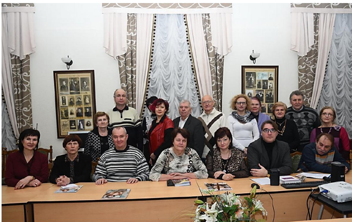
«Словодром # 21»