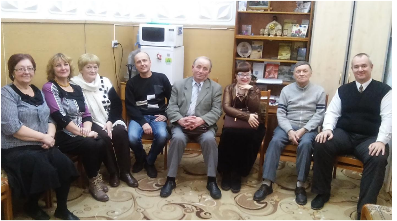
Дискуссионный клуб «Словодром» № 2. До новых встреч.