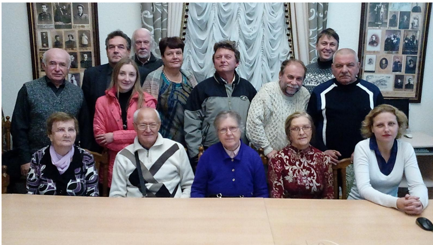
31 октября 2017 года. «Словодром-18». «Мой идеал».

Ещё по теме: репортаж Владимира Михайловича Сытых, за что ему от нас превеликая благодарность: