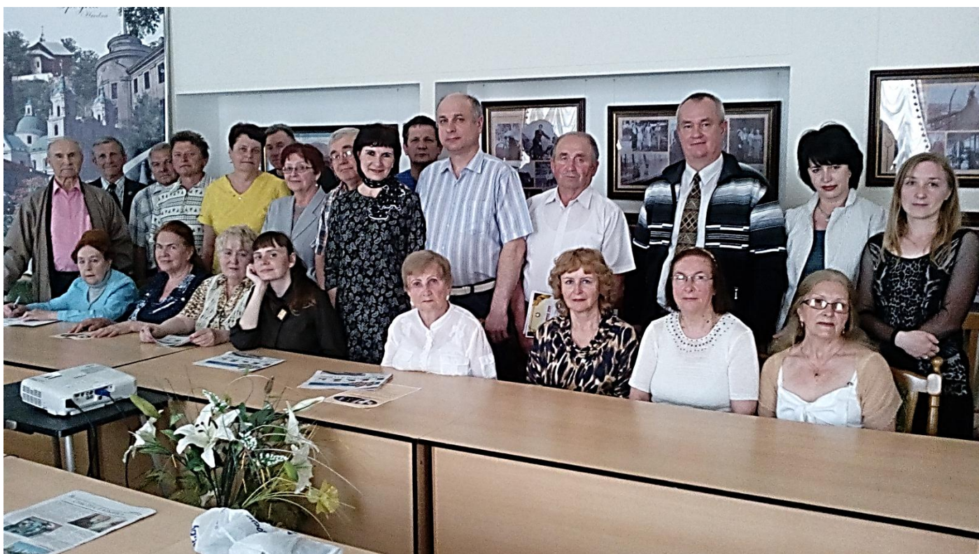
На пути к себе "Словодром-16". 30 мая 2017 года. До новых встреч в новом сезоне!