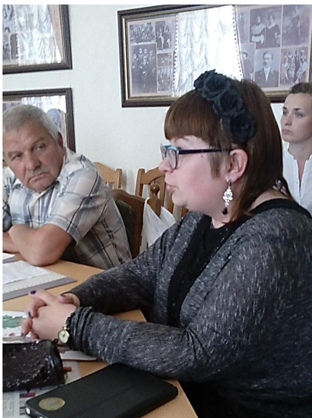
Писатель Мария Титарчук.