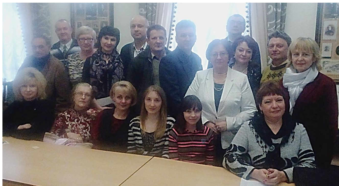
«Словодром #15». Гродно, абласная навучная бібліятэка ім. Е.Ф.Карскаго, 26 красавіка 2017 года.