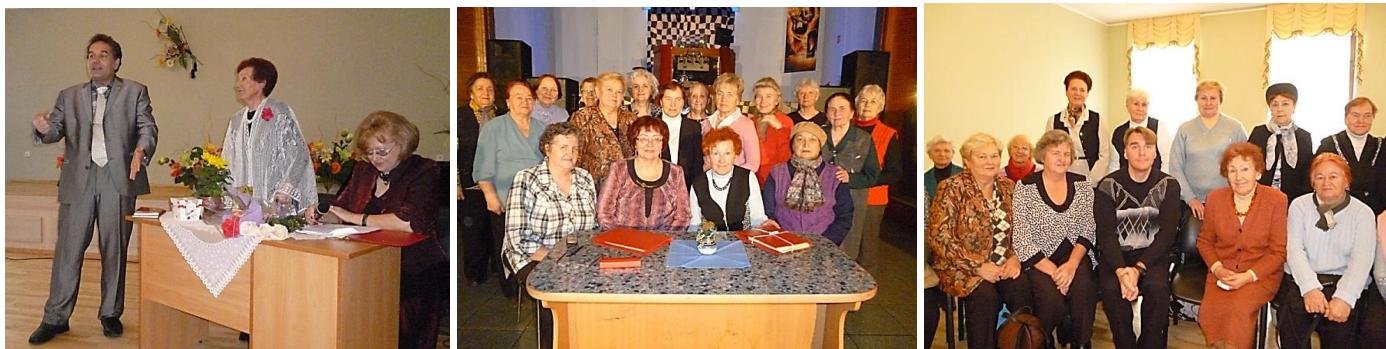
Гродненские писатели в гостях у общественного женского клуба «Современница» (2013-2014).

все другие атрибуты. Но, разумеется, не в лаврах дело, а в элементарном уважении. И мне ничего не оставалось, как грудью ринуться на защиту уязвленной профессиональной гордости.