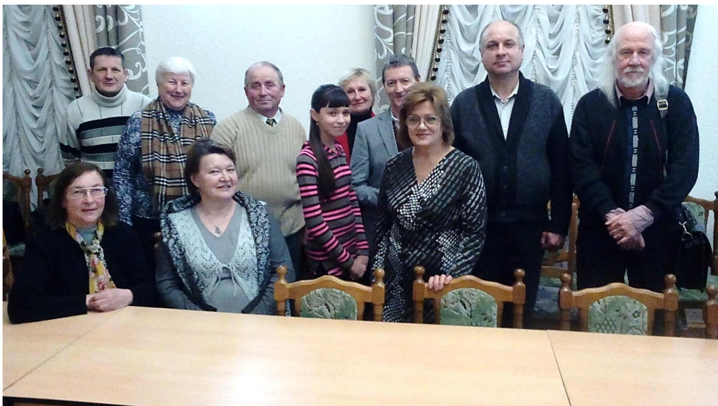
«Словодром-10». 30 ноября 2016 года.