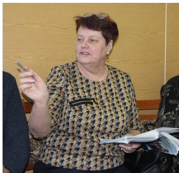
Беларускі прэзаік Ірына Салата