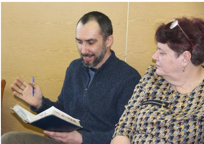
Аматар літаратуры, беларускі паэт Андрэй Бортнік