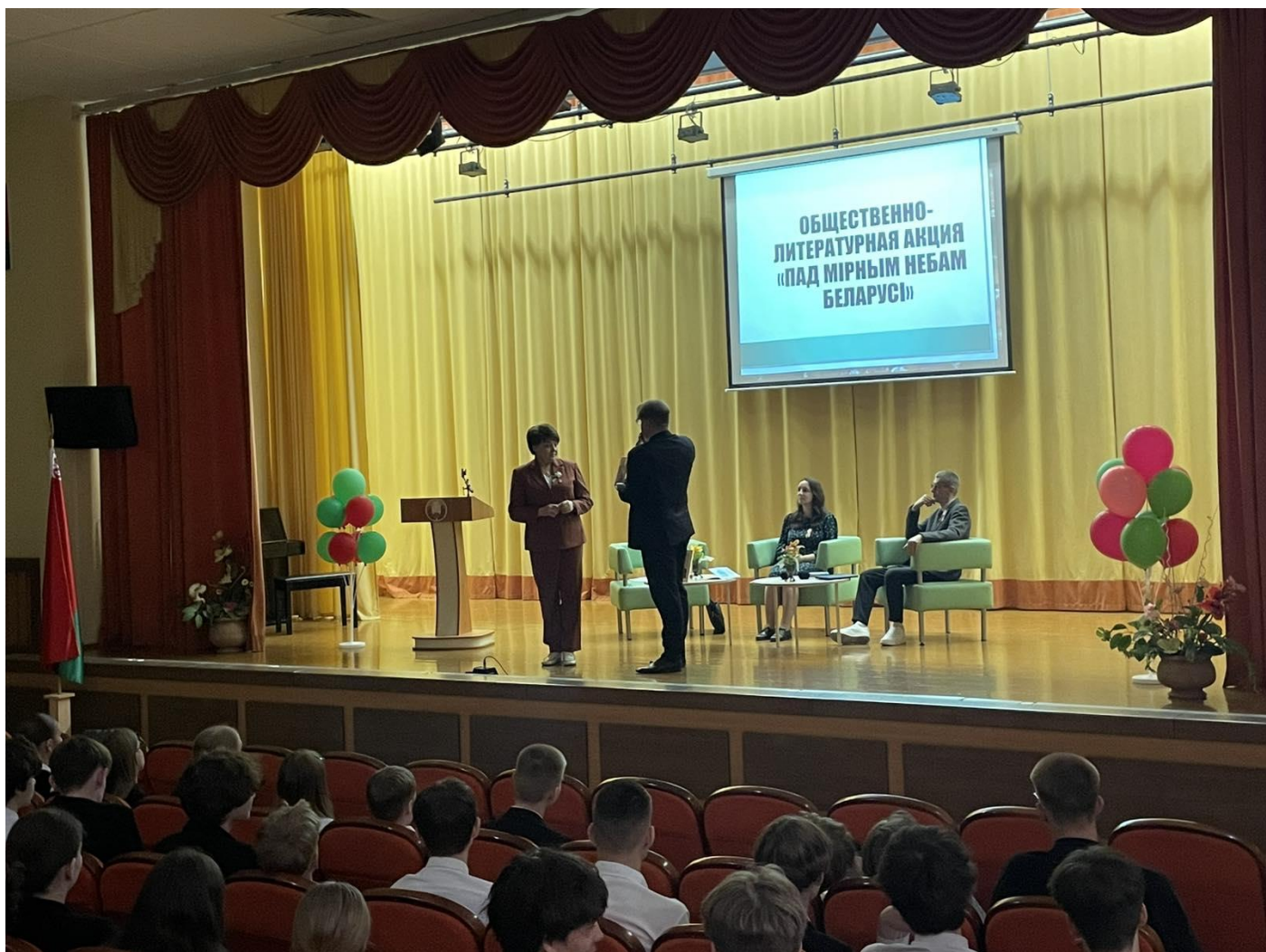
Школе ўручаецца кніга, калектыўны паэтычны зборнік «Память огненных лет» (2025)