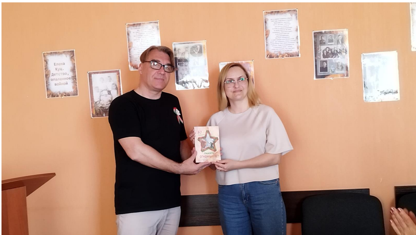
Кніга – у падарунак гаспадарам