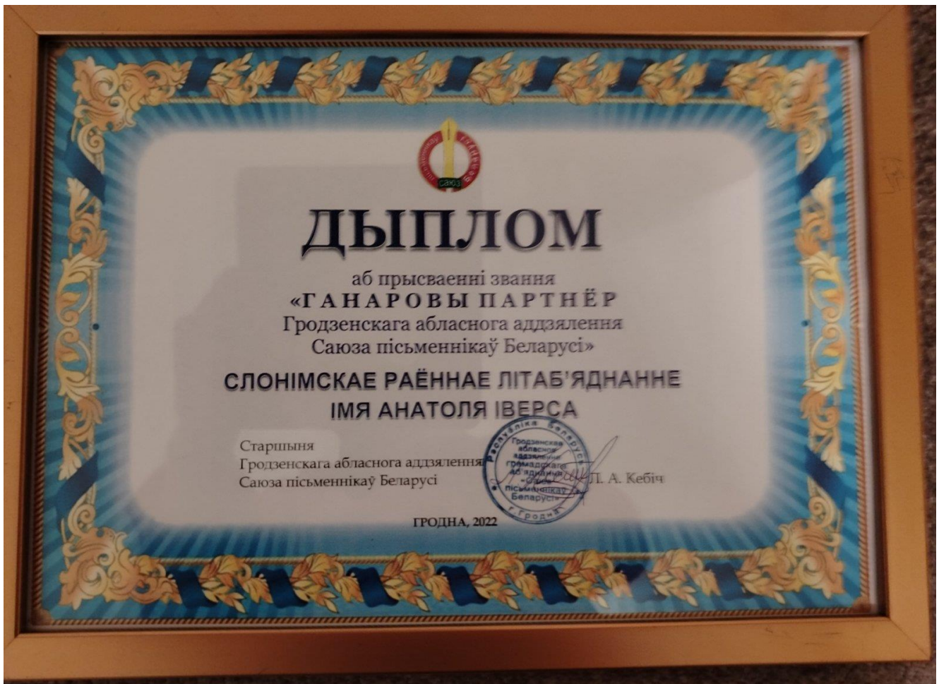
Дыплом аб прысваенні звання «Ганаровы партнёр Гродзенскага абласнога аддзялення Саюза пісьменнікаў Беларусі» (2022)