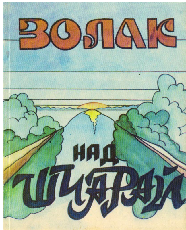
Альманах «Золак над Шчарай» (1994)