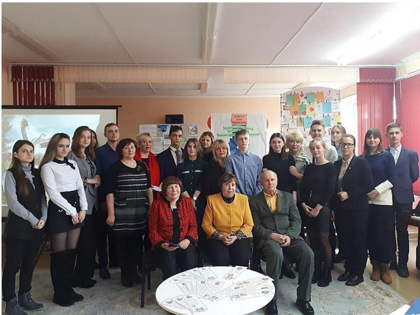
Дзень роднай мовы ў СШ № 8 г. Слоніма