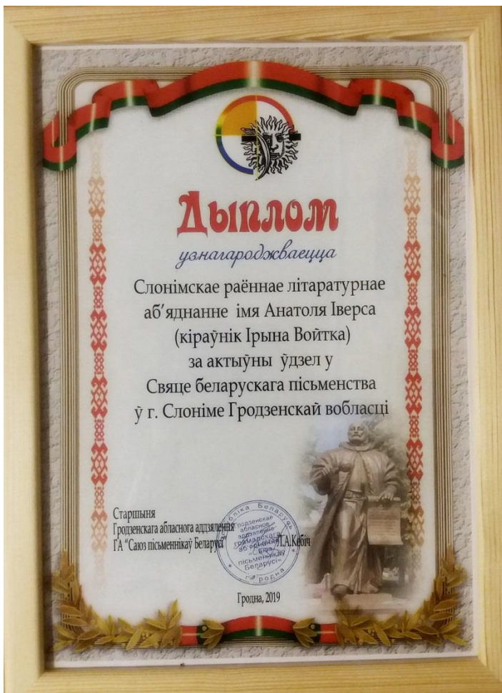
Памятны дыплом аб удзеле Слонімскага раённага літаб'яднання ў Свяце беларускага пісьменства (2019)