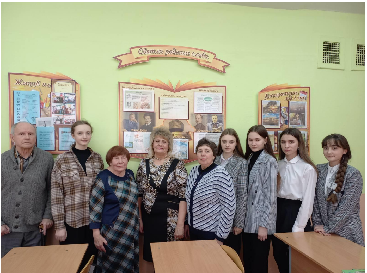
Дзень роднай мовы. СШ № 2 г. Слоніма