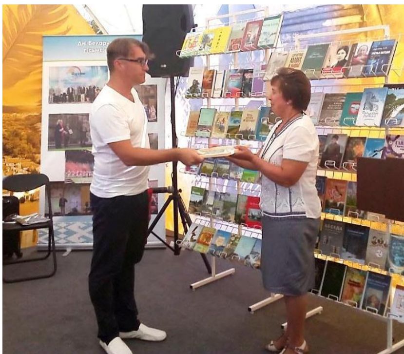
Дзень беларускага пісьменства ў Слоніме. Уручэнне дыплама ганаровага ўдзельніка свята Слонімскаму раённаму літаратурнаму аб'яднанню імя Анатоля Іверса (2019)