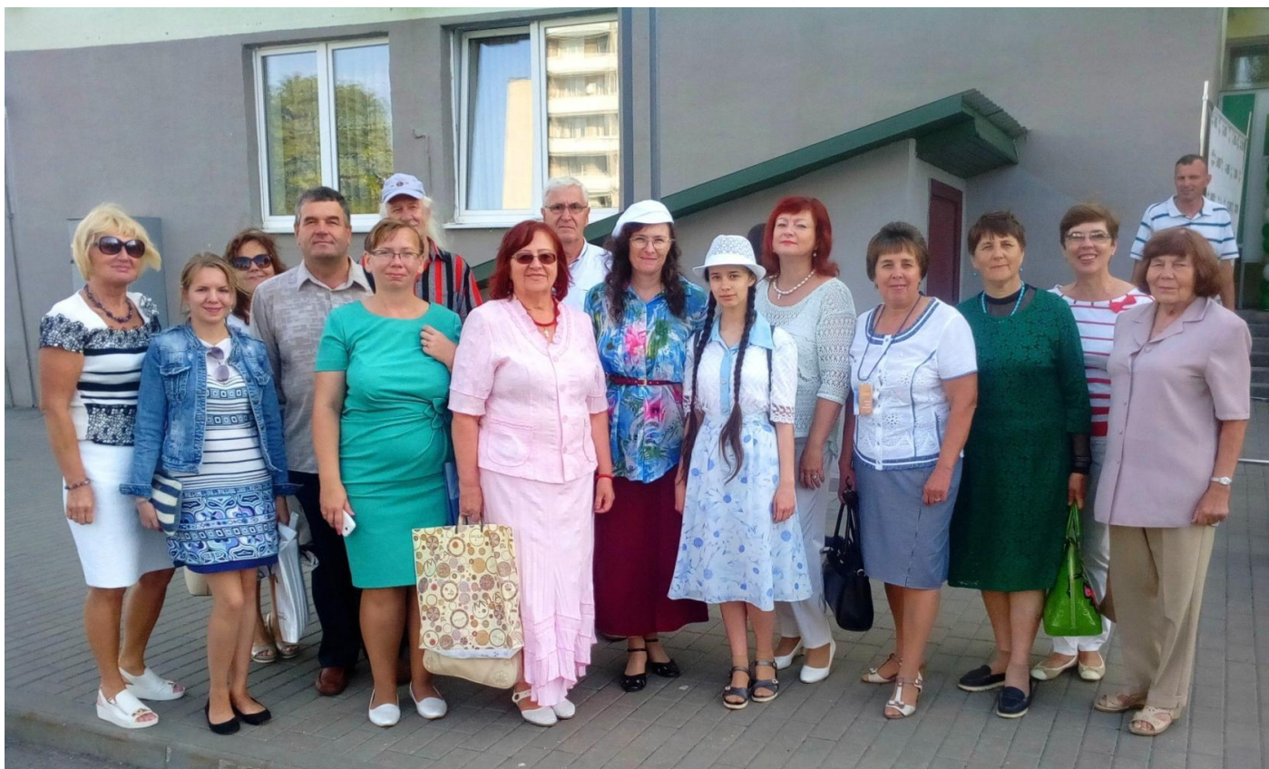
З гродзенскімі калегамі. Слонім, 2019 г.