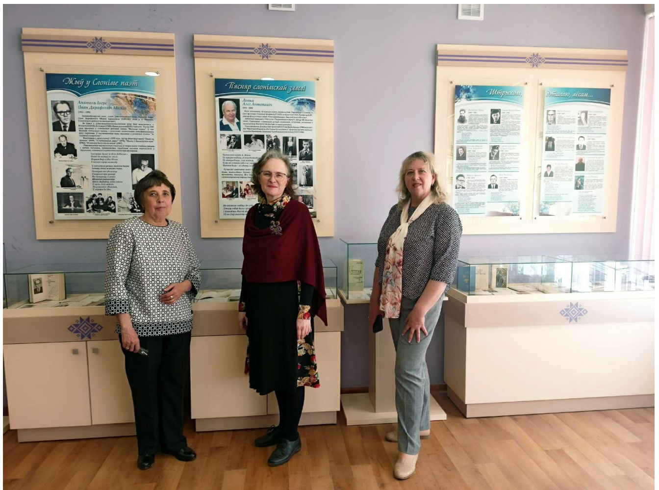
Адкрыццё літаратурна-этнаграфічнага музея ў СШ № 8 г.Слонім