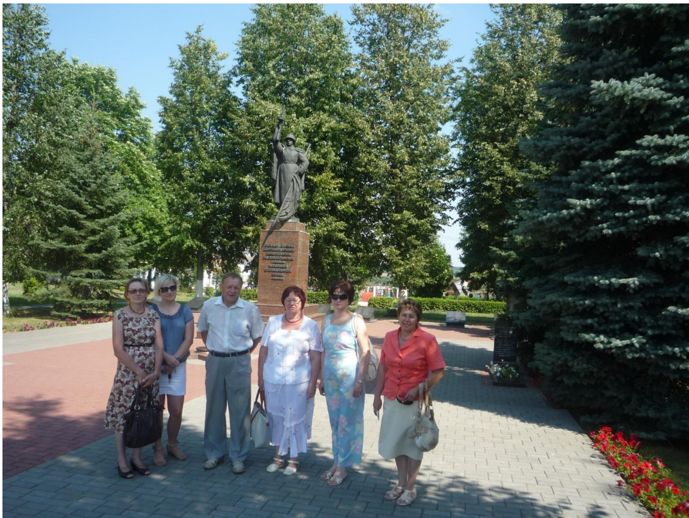
Гродзенскія паэты ў гасцях у слонімцаў. 2012 г.