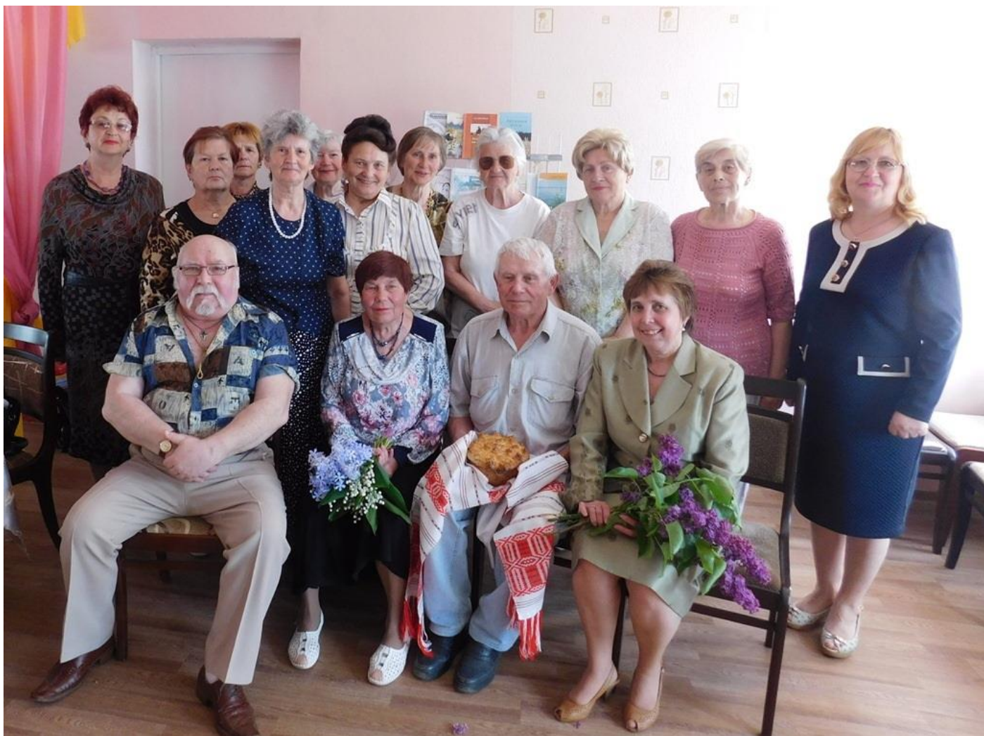
У гасцях у зэльвенцаў