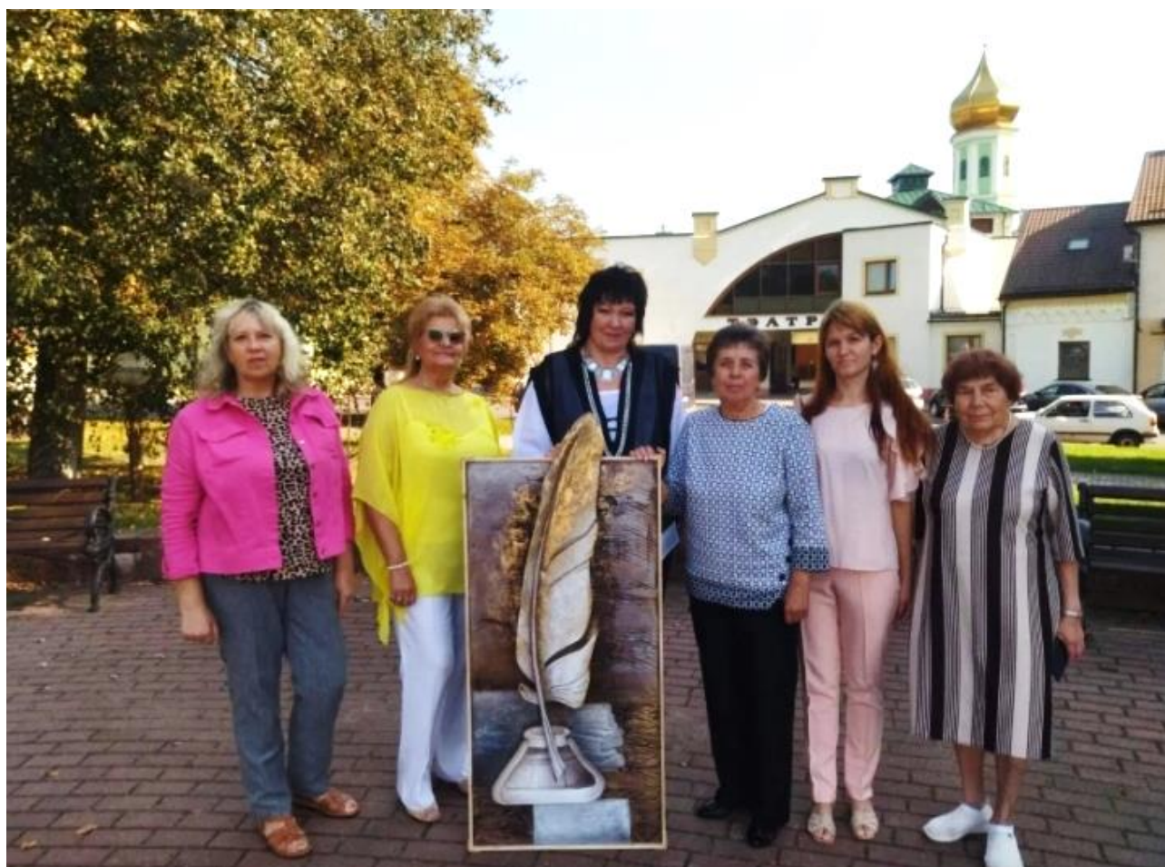
На 80-годдзі Слонімскай раённай бібліятэкі імя Якуба Коласа