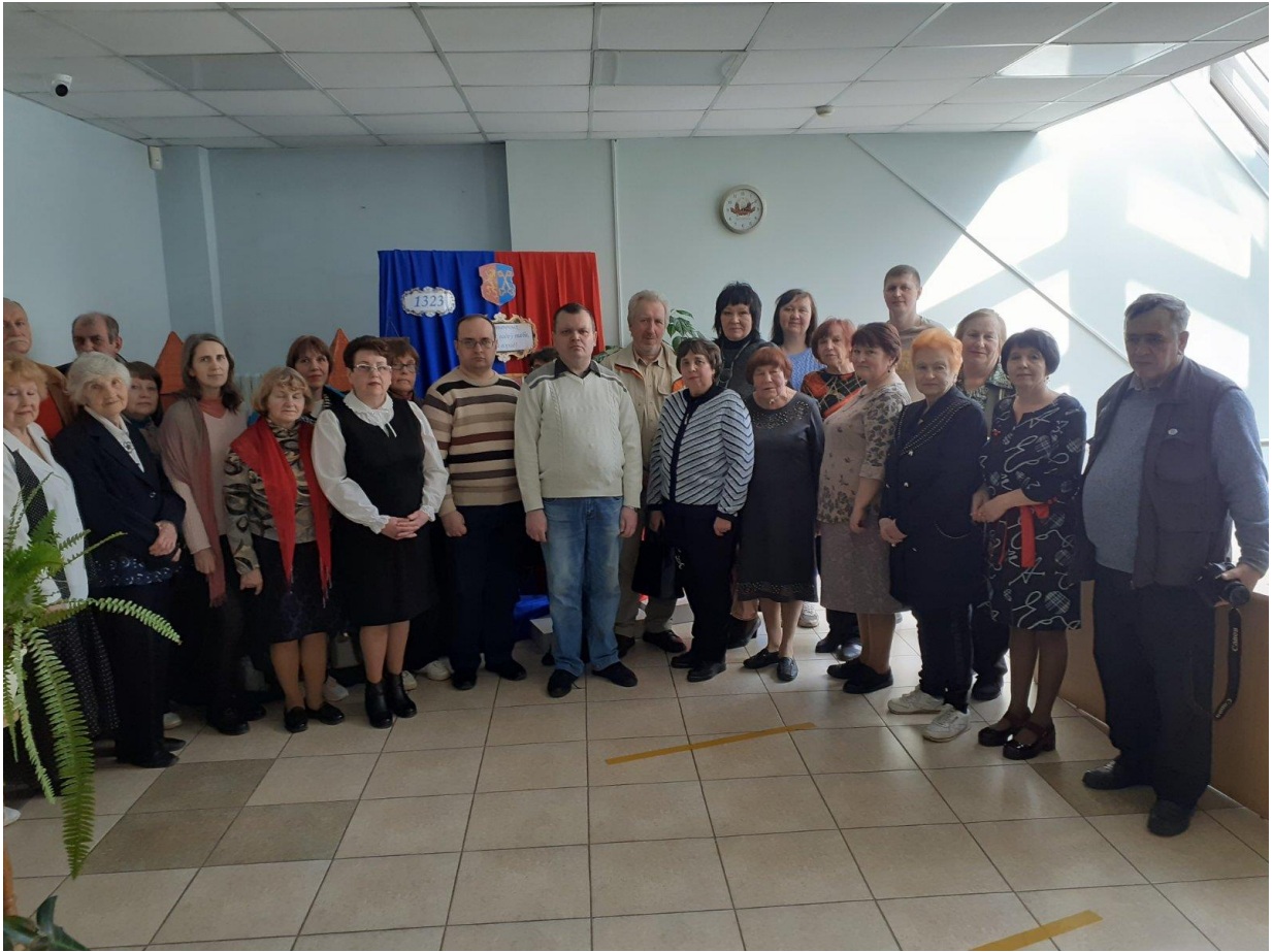
Сустрэча з калектывам Лідскага раённага літаб'яднання «Суквецце» (Лідская раённая бібліятэка імя Янкі Купалы)