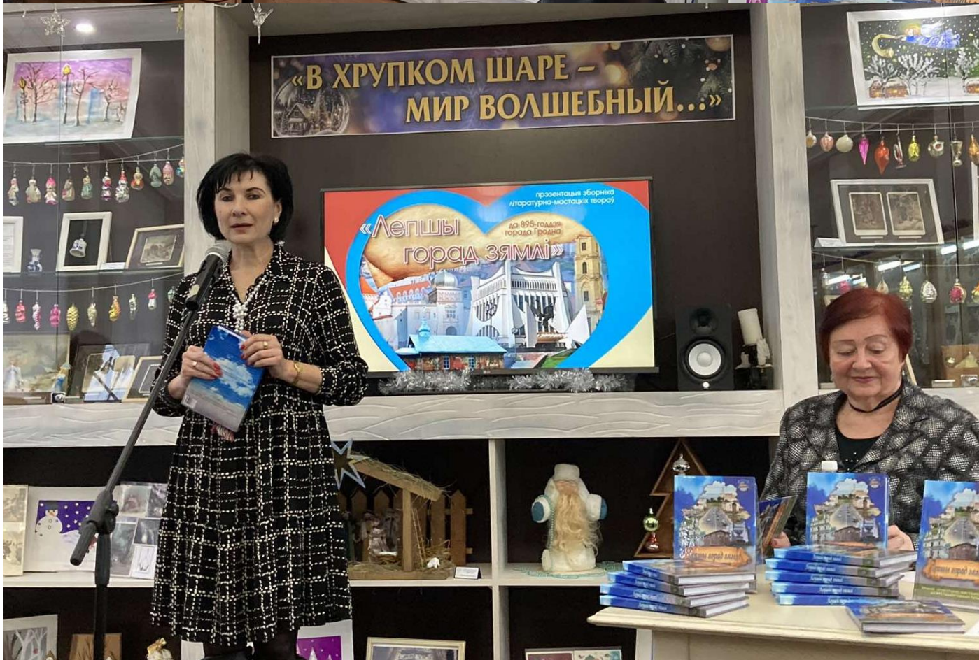
Выступае аўтар прадмовы да зборніка, член СПБ, лаўрэат Нацыянальнай літаратурнай прэміі Беларусі (2023), літаратуразнаўца, літаратурны крытык Аліна Сабуць