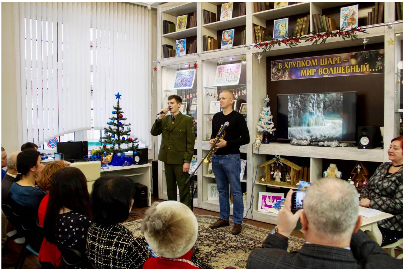
Гучыць песня на словы Людмілы Кебіч і музыку Ірыны Трацяк «Граніца»