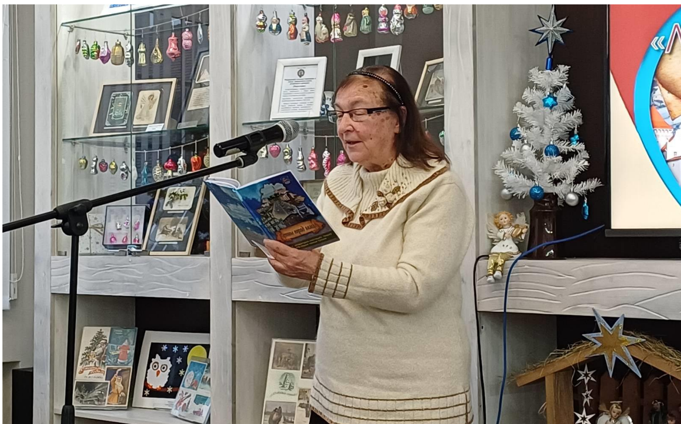
Паэтэса Святлана Барнавалава