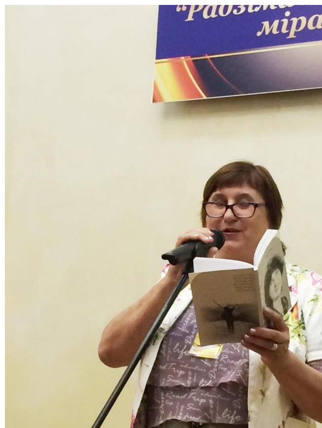
Паэтэса Тамара Мазур