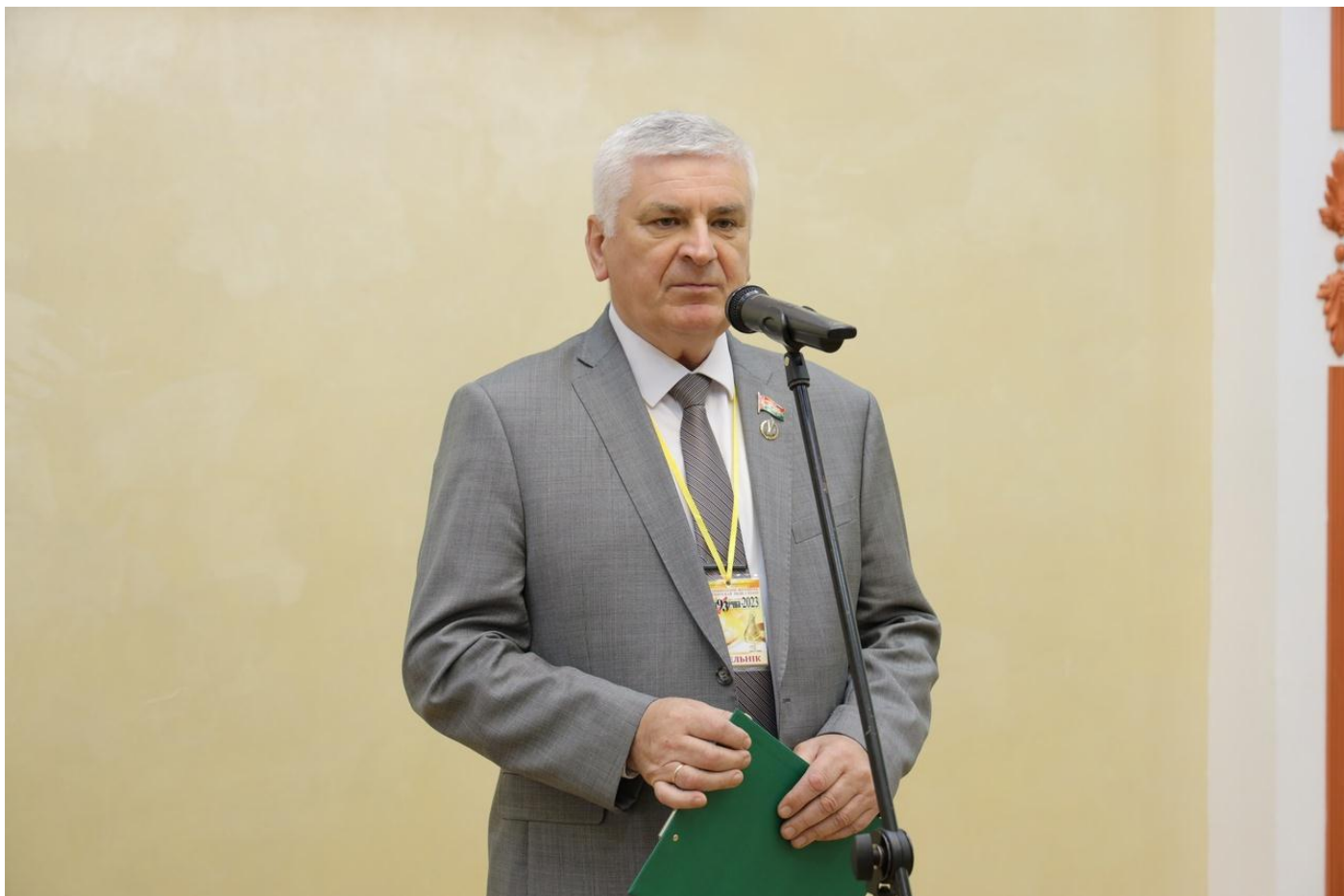
Дзяржаўны, палітычны дзеяч, беларускі паэт Валянцін Семяняка