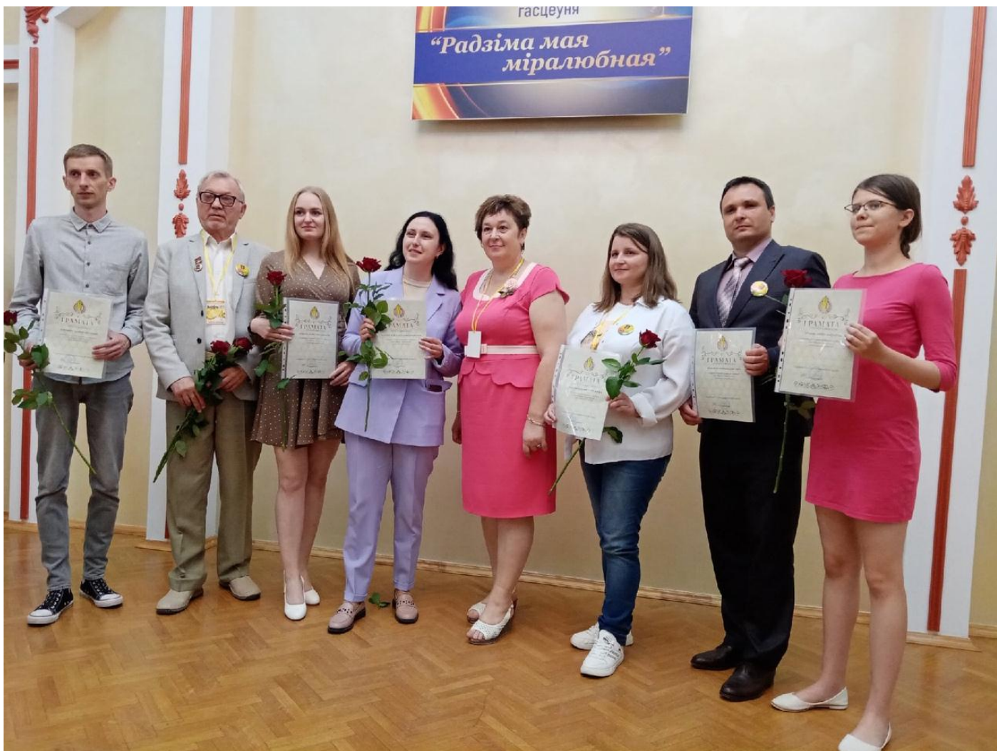
Пасля цырымоніі ўзнагароджання лаўрэатаў Першага рэспубліканскага літаратурнага конкурсу імя Міколы Мятліцкага сярод маладых паэтаў