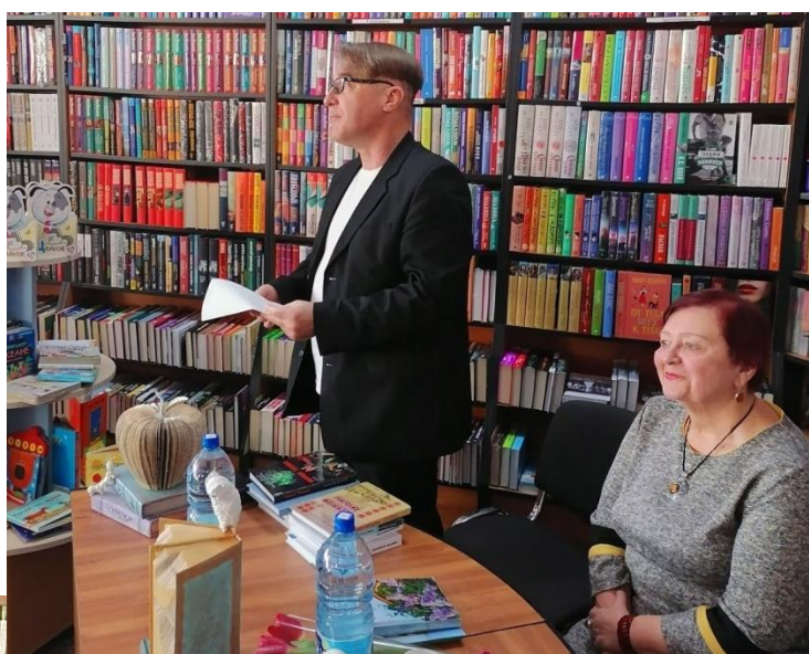
Выступае госць з Гродна, паэт Дзмітрый Радзівончык