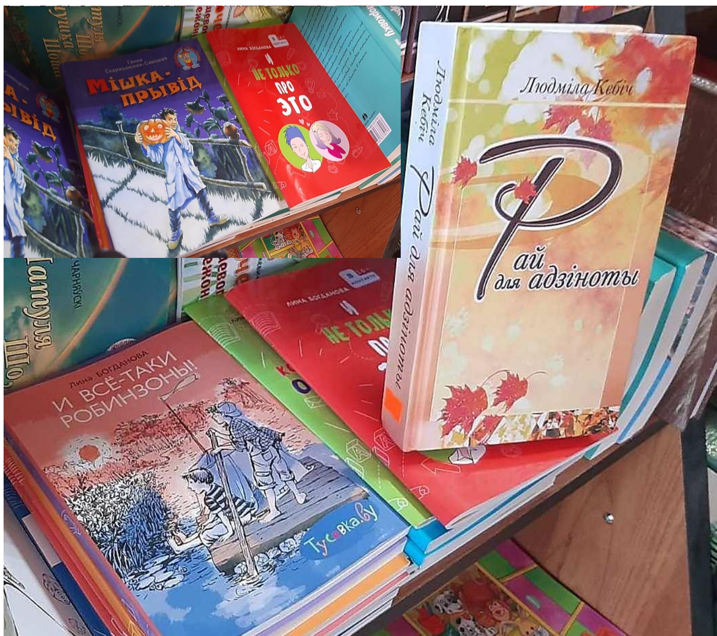
На паліцах крамы «Книжный мир» (г. Ліда) – кнігі нашых калег па СПБ Ганны Скаржынскай-Савіцкай, Ліны Багданавай і Людмілы Кебіч

На фота: падчас пасяджэння літаратурнай гасцёўні «Выход у свет» (ініцыятар – паэт Руслан Півавараў), прысвечанага выданню дэбютнай кнігі паэтэсы Святланы Піваваравай «Люблю... Как много и как мало...» і Міжнароднаму дню паэзіі. Кніжная крама «Книжный мир», горад Ліда, 18 сакавіка 2023 года.