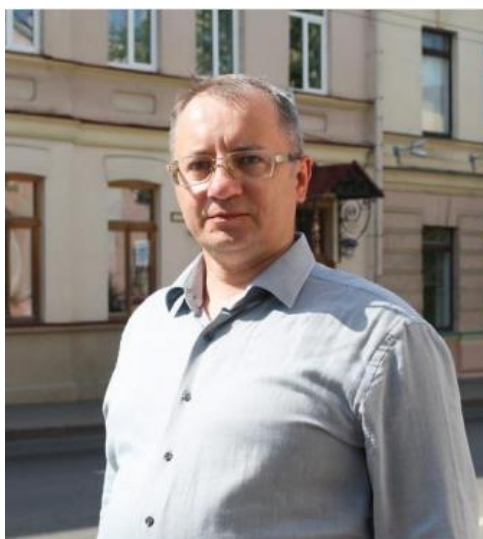
Александр СЕВЕНКО. Об авторе