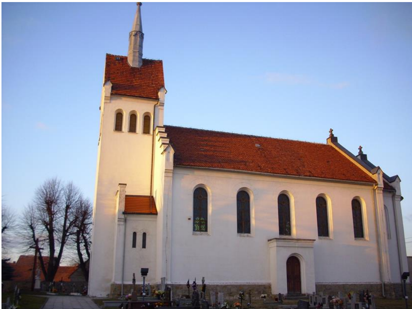
Храм Святой Екатерины в Мыслакове

гродненцу исполнилось 47 лет, он не выдержал тоски по Родине, явился к мэру деревни и попросил составить прошение, в котором изложил историю своих злоключений. «Посему прошу