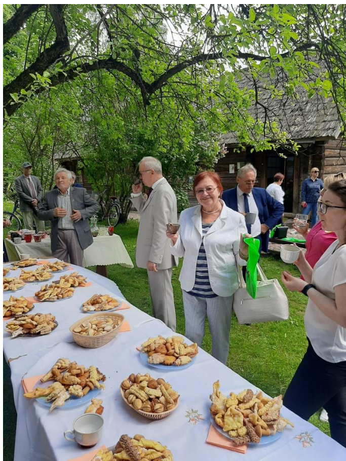
Зёлкавая гарбата і салодкі пачастунак па-Купалаўску