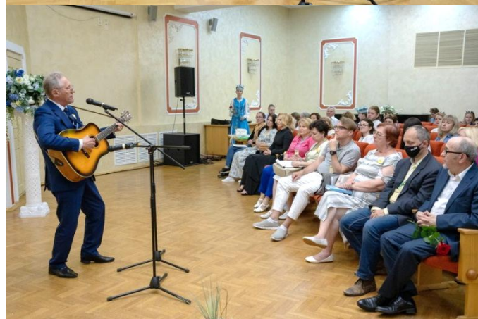
Выступае бард Віктар Мяцельскі