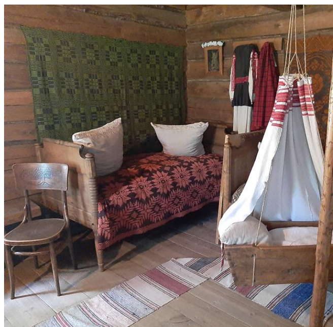
Вось так сёння выглядае адна з духоўных крыніц кожнага беларуса

Калі трапляеш у такое месца, пачынаеш усведамляць святасць нашай гістарычнай памяці, важнасць у любых умовах, ва ўсе часы быць годным нашага мінулага. Бо менавіта здольнасць чалавека, балансуючы паміж традыцыяй і сучаснасцю, знаходзіць свой твар, сваё месца пад сонцам, а місія ўсяго грамадства – займаць «свой пачэсны пасад між народамі» і называецца ўласна культурай, культурным кодам нацыі.