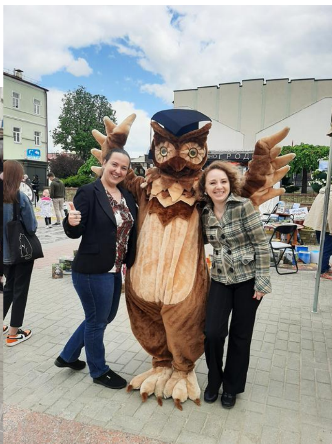
«Гарадзенскі ЛітФэст-2021». На фестывальнай пляцоўцы пануе свая непаўторная атмасфера