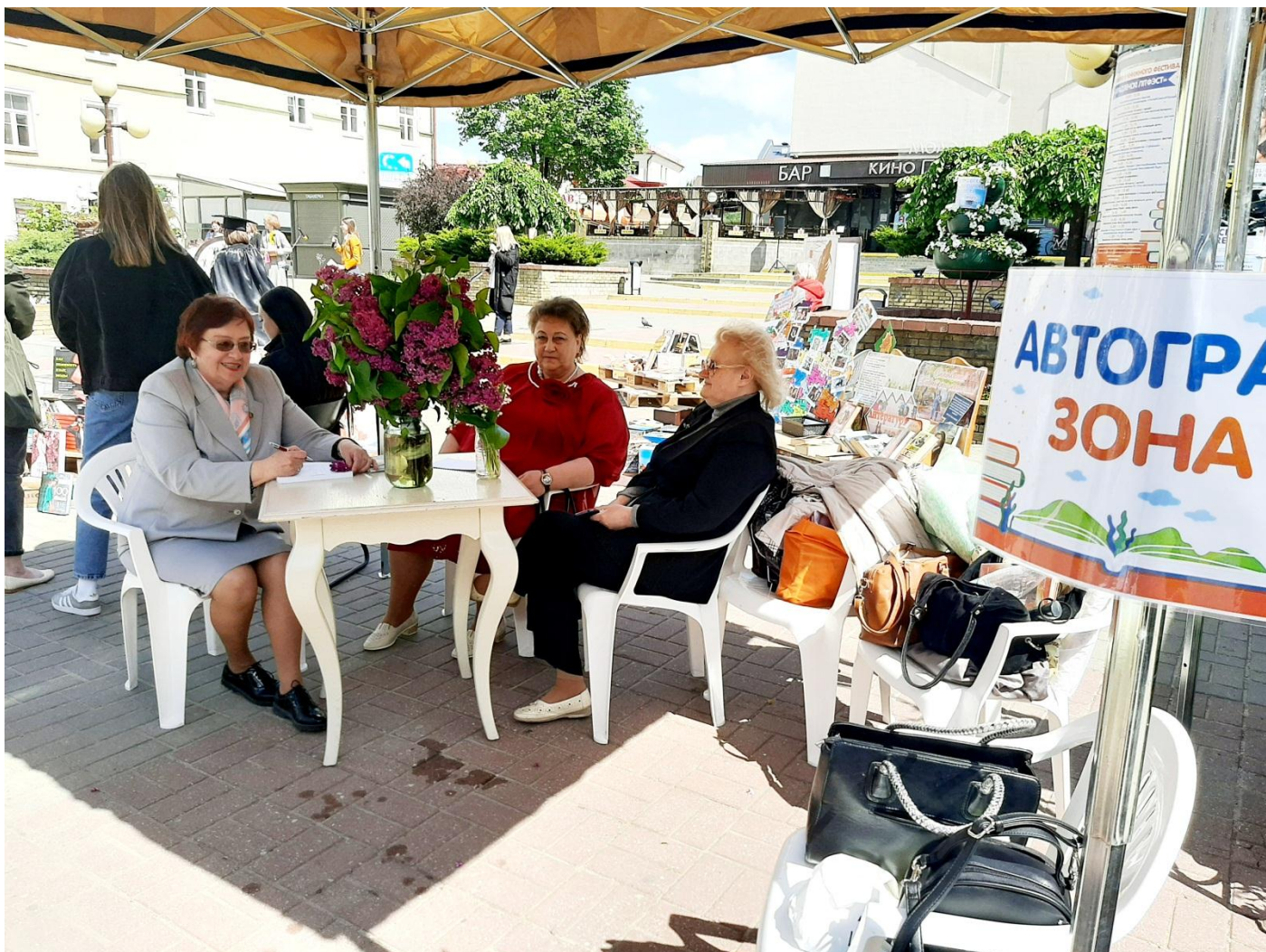
У аўтограф-зоне фестывалю ідуць аўтограф-сесіі сучасных беларускіх пісьменнікаў