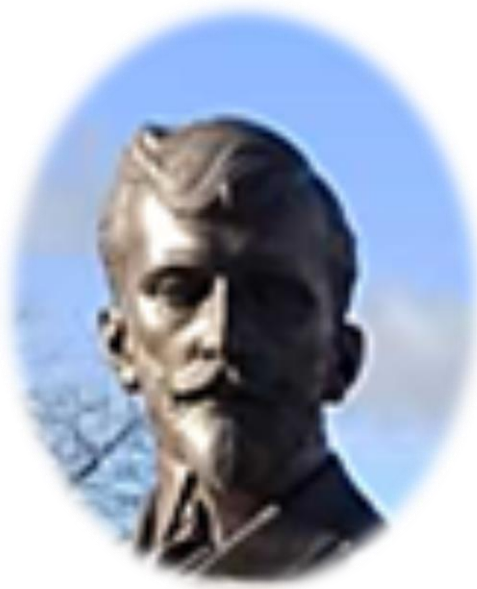
Фердынанд Рушчыц (1870-1936)

Дзённікавыя запісы Рушчыца маюць вялікае пазнавальнае значэнне, абумоўленае тым, што даюць разнастайныя веды пра жыццё грамадства, гістарычныя падзеі, характэрныя прыроды роднага краю і месца ў ёй чалавека. І ўсё гэта раскрываецца ярка, праз мастацкую вобраснасць, філасофскае асэнсаванне, жыццёва і эмацыянальна.