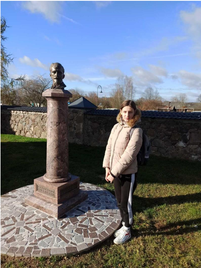
Фотаздымкі з радзімы Фердынанда Рушчыца.