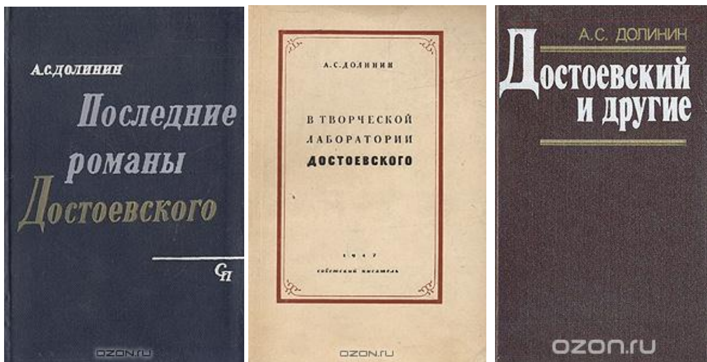
Некоторые издания А.С. Долинина

Избранные труды А.С. Долинина: «В творческой лаборатории Достоевского» (1947), «Последние романы Достоевского» (1963), «Достоевский и другие» (1989). Подготовил к печати четыре тома писем Ф.М. Достоевского, где прослежены связи с другими русскими художниками слова, раскрыта творческая лаборатория писателя. Выступил инициатором и редактором издания «Ф.М. Достоевский. Статьи и материалы» (1922, 1924, 1935). Участвовал в подготовке изданий А.С. Пушкина, Ф.М. Достоевского и других русских писателей. Подготовил сборник материалов «Русские писатели XIX века о Пушкине» (1938). «Ф.М. Достоевский в воспоминаниях современников» в двух томах (1964).