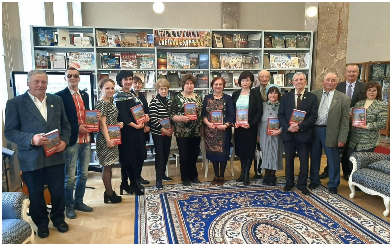
Гродзенская абласная навуковая бібліятэка імя Я. Ф. Карскага. 21 красавіка 2022 года