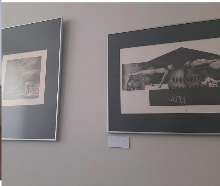
Культурный центр «Фестивальный» – территория искусства