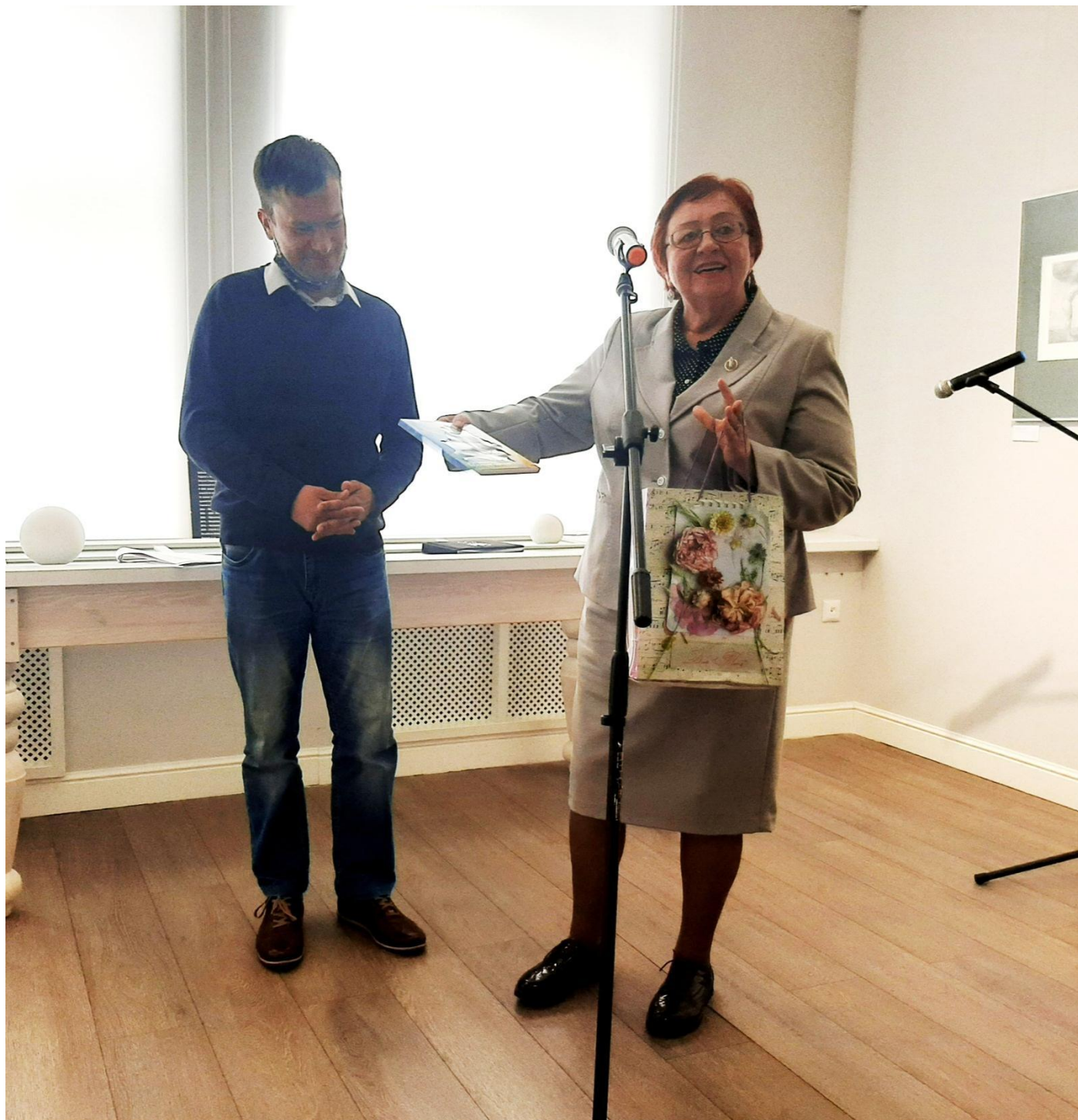
Дружеский обмен подарками

На фото: встреча творческого десанта из города Гомеля с гродненскими любителями искусства. Культурный центр «Фестивальный». Гродно, 21 мая 2021 года.