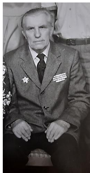
Одно из последних фото

Вспоминаю, какую невыносимую гордость испытывал я, шествуя рядом с дедом, когда в первые майские дни ему отдавали честь все встречные военнослужащие. Однажды дед признался нам, что в подкладку его фронтовой гимнастёрки была вшита молитва «Отче наш». Она оберегала солдата всю войну. Так и прошёл он её с Богом, как и всю свою жизнь. ...Как видите, в силу разных причин рассказ про деда получился не совсем рассказом о войне. И тем не менее. Безмерную сердечную благодарность за всё, дань памяти и любви от внука он вполне заслужил. Думается, люди подобного склада – скромные труженики, волевые, чистые душой жизнелюбы и слагали настоящий советский народ. Несгибаемый, самодостаточный, мудрый. Этому народу было бы по плечу ещё очень многое. Но, как известно, не терпит история сослагательного наклонения. Деда не стало в апреле 1991 года. До распада СССР он не дожил. Есть мнение, что и не перенёс бы таких глобальных политических потрясений – когда большая, единая страна, за которую четыре года ходил в атаку, которую потом без устали восстанавливал из руин, вдруг перестала существовать. Израненное болью сердце ветерана этого бы уж точно не выдержало. Как удивительно, думаю я сегодня – казалось бы, обычный человек. Ничем не выдающийся. А стал для меня недостижимым примером.