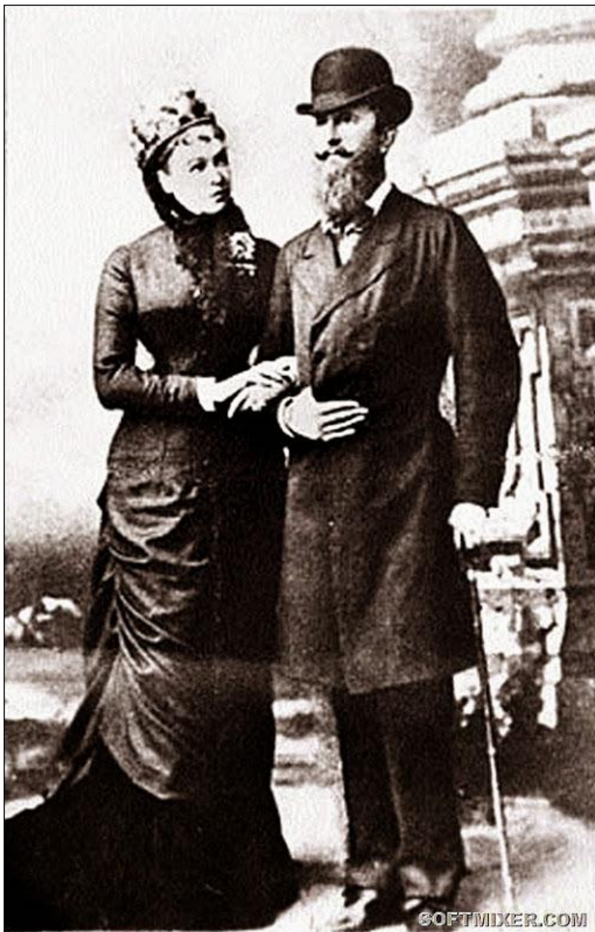
Принц Николай-Вильгельм Нассауский с женой Натальей Александровной Пушкиной-Дубельт, графиней Меренберг, 1880-е годы, Висбаден