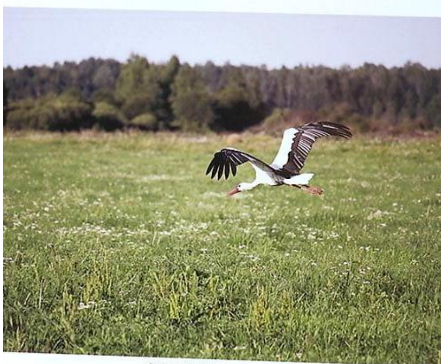
Земля под белыми крыльями