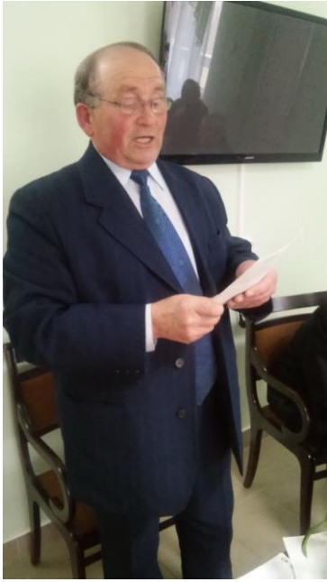
Поэт Григорий Гармаш.