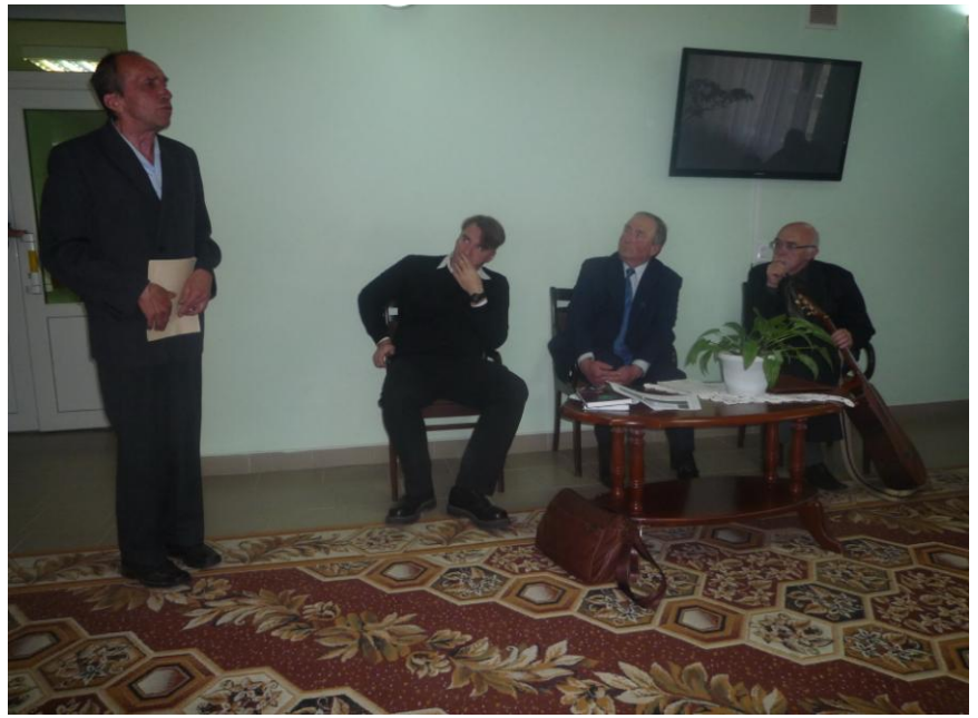
Слово принимающей стороне.