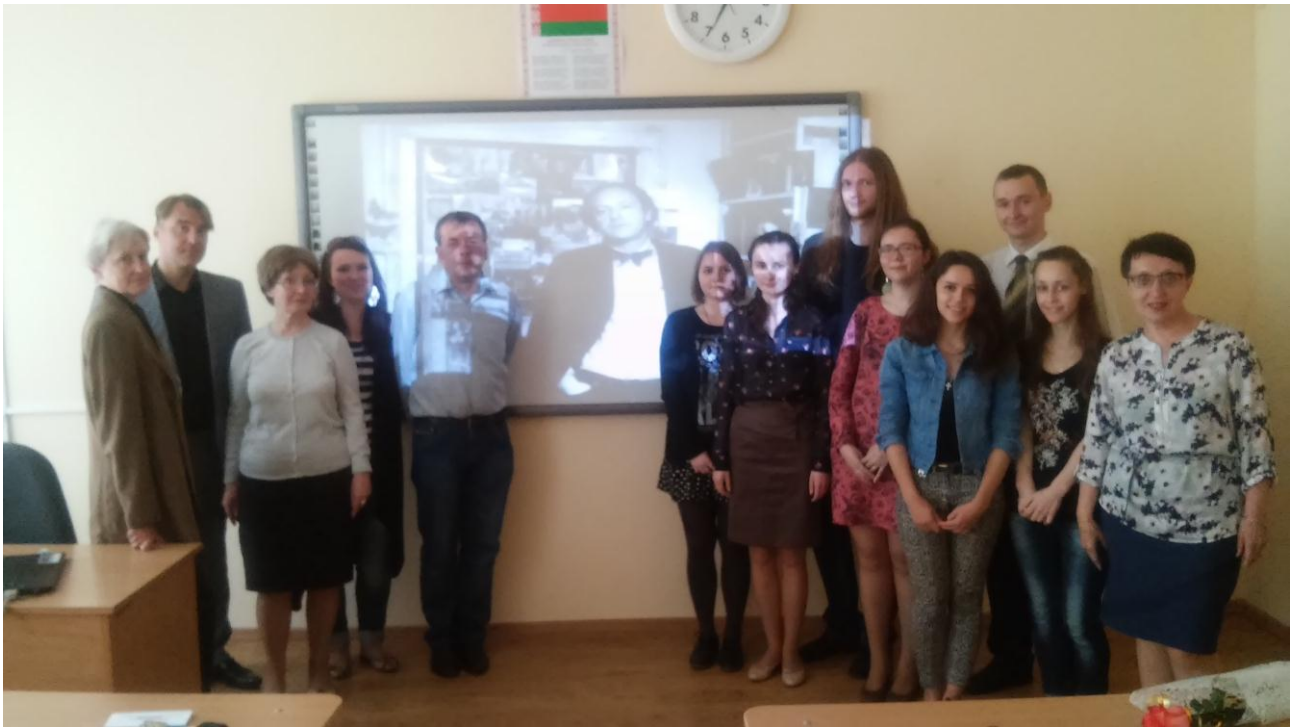
Филологический факультет ГрГУ им. Я.Купалы. 25 мая 2015 года.