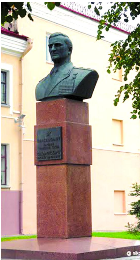
Помнік В.Д.Сакалоўскаму ў Гродне

Жыў у горадзе-героі Маскве. Памёр 10 мая 1968 года. Ён пахаваны ў Маскве на Чырвонай плошчы ля Крамлёўскай сцяны. Воінскія званні: камдзіў (1935/11/20), камкор (1939/12/31), генерал-лейтэнант (1940/06/04), генерал-палкоўнік (1942/06/13), генерал арміі (1943/08/27), Маршал Савецкага Саюза (1946/07/03). Узнагароджаны 8 ордэнамі Леніна (1941/02/22, 1942/01/02, 1945/02/21, 1945/05/29, 20.07.1947, 1948/06/24, 1957/07/20, 1967/07/20), ордэнам Кастрычніцкай Рэвалюцыі (1968/02/22), 3 ордэнамі Чырвонага Сцяга (1928/02/28, 1944/11/03, 1949/06/20), 3 ордэнамі Суворова 1-й ступені (1943/04/09, 1943/09/28, 1945/04/06), 3 ордэнамі Кутузава 1-й ступені (1943/08/27, 25.08.1944, 1956/12/18), медалямі СССР і інш.