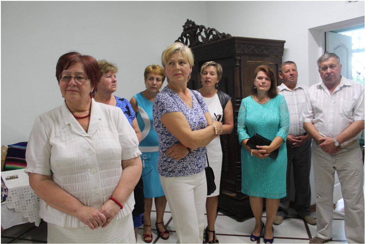
На выставе мастака Дзмітрыя Іваноўскага.