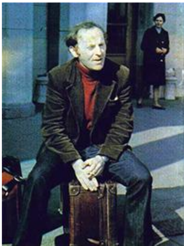
Иосиф Бродский перед отлетом

Все эмигранты делали своей профессией утраченное отечество, воевали с советской властью и т.д. — это был гарантированный кусок хлеба. Бродский категорически отказывается от этого. Он идет преподавать, осваивает язык, уезжает в Мичиган и живет практически в стерильном одиночестве несколько лет.