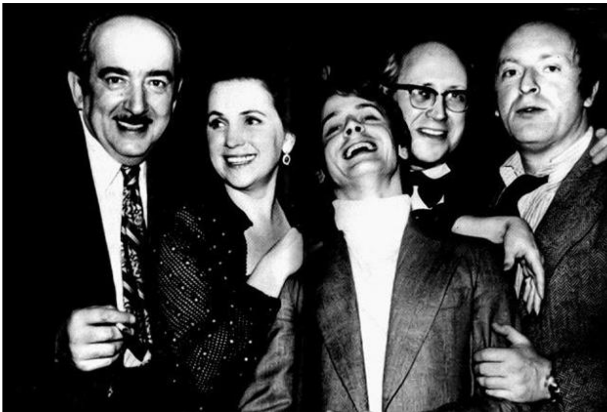
Александр Галич, Галина Вишневская, Михаил Барышников, Мстислав Ростропович, Иосиф Бродский